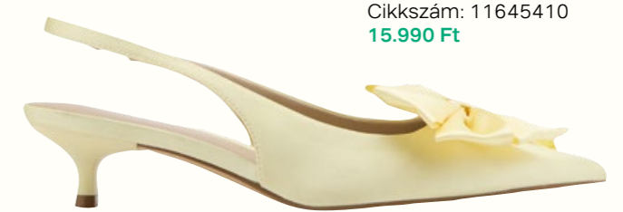
Cikkszám: 11645410 15.990 Ft