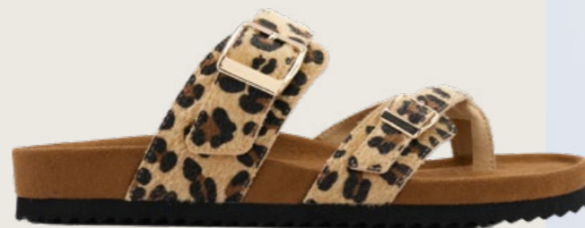
Cikkszám: 12613734 9.990 Ft