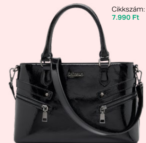
Cikkszám: 41004604 7.990 Ft