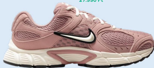
Cikkszám: 18214204 27.990 Ft