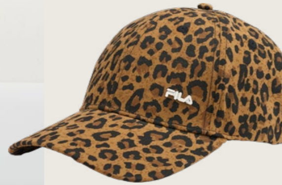
Cikkszám: 46903016 4.990 Ft