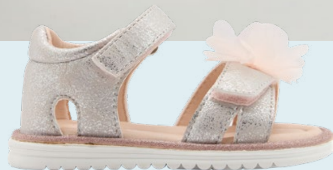
Cikkszám: 14095178 8.990 Ft