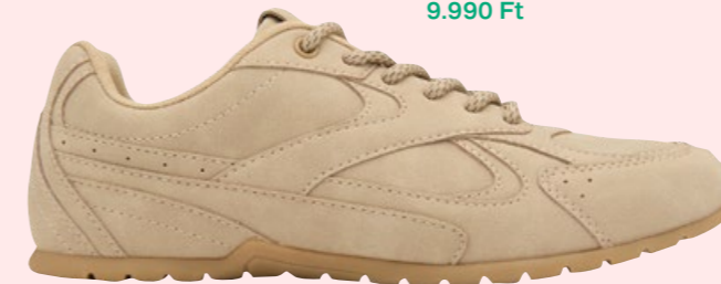
Cikkszám: 11025054 9.990 Ft