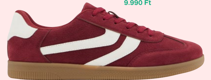
Cikkszám: 11025072 9.990 Ft