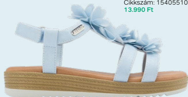
Cikkszám: 15405510 13.990 Ft