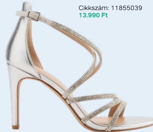
Cikkszám: 11855039 13.990 Ft