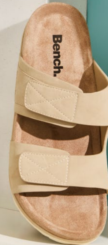
Cikkszám: 13535312 11.990 Ft