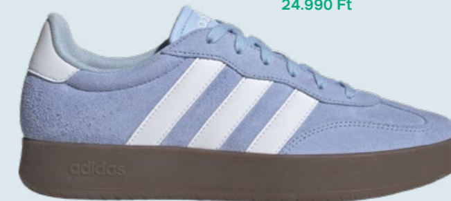
Cikkszám: 18403332 24.990 Ft