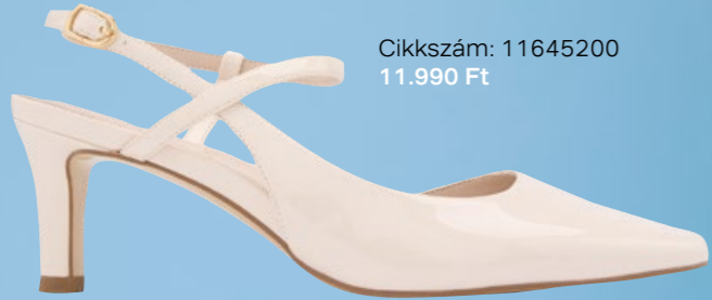
Cikkszám: 11645200 11.990 Ft