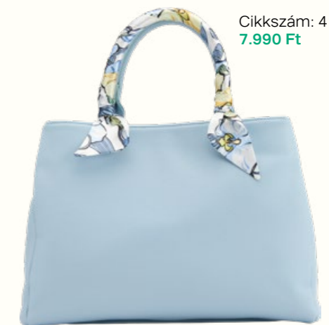
Cikkszám: 41005160 7.990 Ft