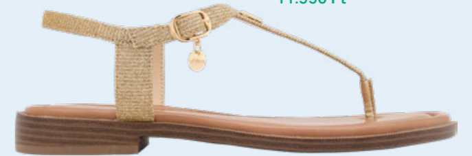
Cikkszám: 12105821 11.990 Ft