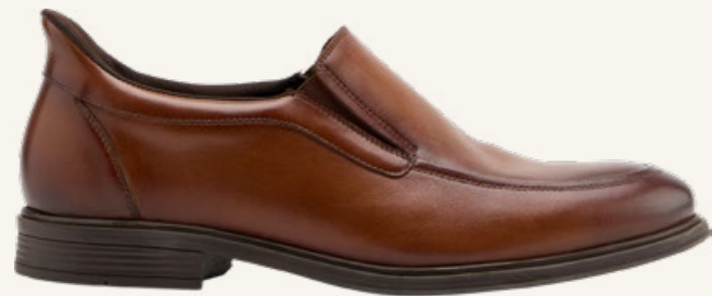
Cikkszám: 13115352 15.990 Ft