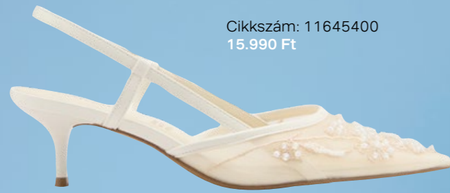
Cikkszám: 11645400 15.990 Ft