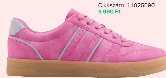
Cikkszám: 11025090 9.990 Ft

A sportos sneakerek mellé egy letisztult, bőr- vagy nejlonhátású táskák dukálnak. 2026-ban újra a nagyobb méretű válltáskák jönnek divatba, amelyeket nyugodt szívvel pakolhatunk tele mindennel, amire csak szükségünk lehet a rohanós hétköznapok során.