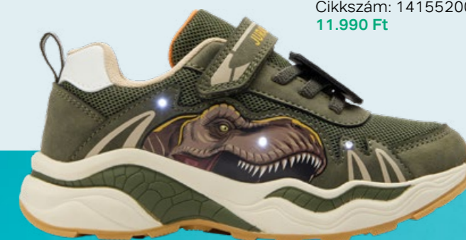
Cikkszám: 14155200 11.990 Ft