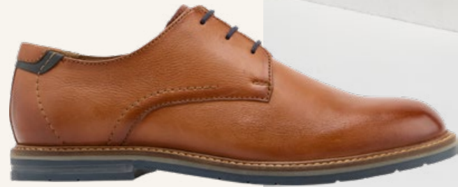
Cikkszám: 13315002 15.990 Ft