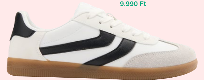
Cikkszám: 11025070 9.990 Ft