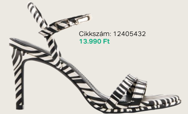
Cikkszám: 12405432 13.990 Ft