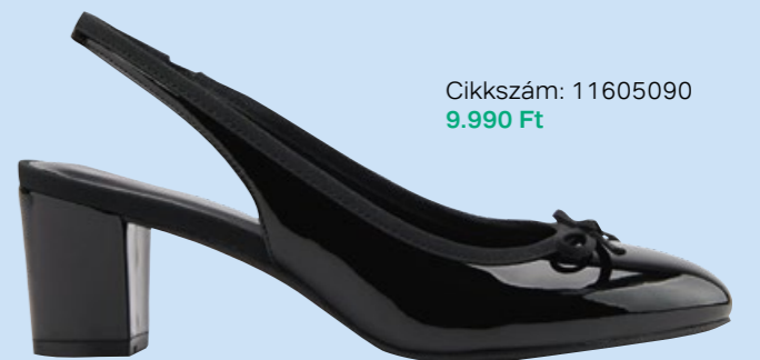
Cikkszám: 11605090 9.990 Ft