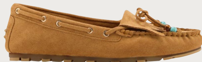
Cikkszám: 11445029 9.990 Ft