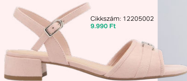
Cikkszám: 12205002 9.990 Ft