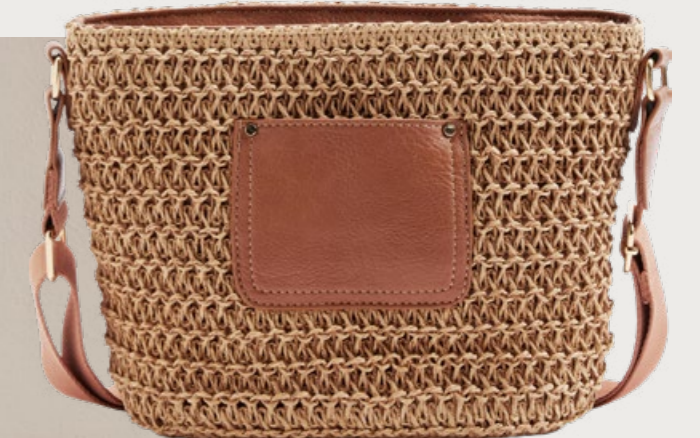
Cikkszám: 41001660 7.990 Ft