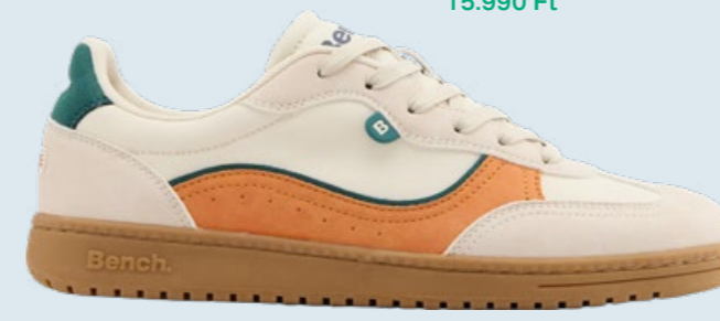
Cikkszám: 13135202 15.990 Ft