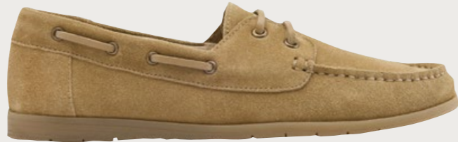
Cikkszám: 11455600 15.990 Ft