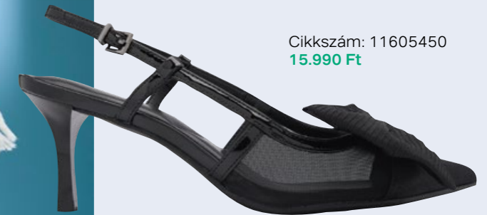
Cikkszám: 11605450 15.990 Ft