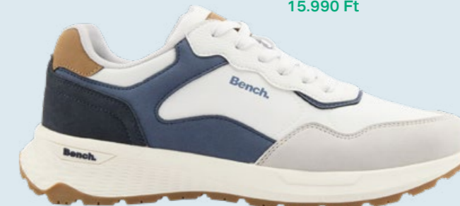
Cikkszám: 13135222 15.990 Ft