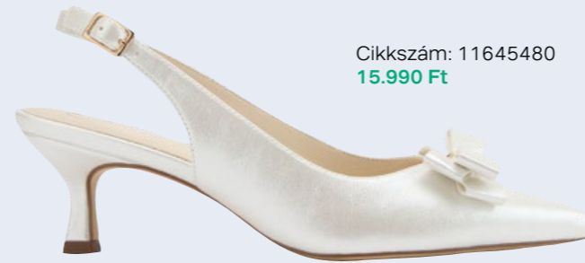
Cikkszám: 11645480 15.990 Ft