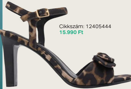
Cikkszám: 12405444 15.990 Ft