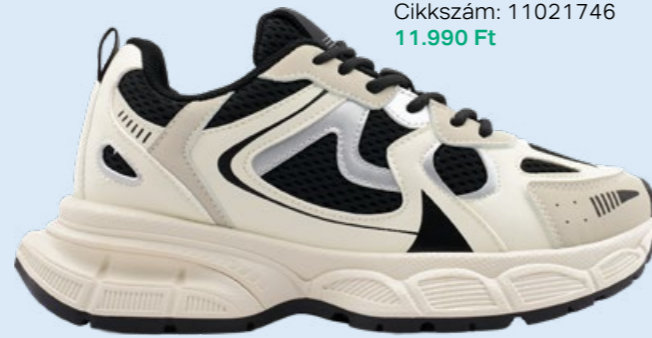
Cikkszám: 11021746 11.990 Ft