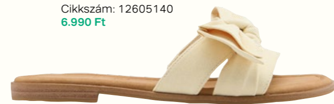
Cikkszám: 12605140 6.990 Ft