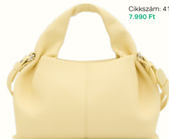
Cikkszám: 41005120 7.990 Ft