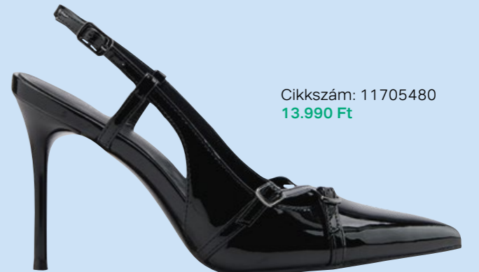
Cikkszám: 11705480 13.990 Ft