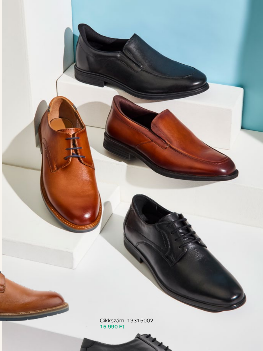
Cikkszám: 13335050 24.990 Ft