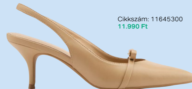
Cikkszám: 11645300 11.990 Ft