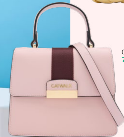
Cikkszám: 41005104 7.990 Ft