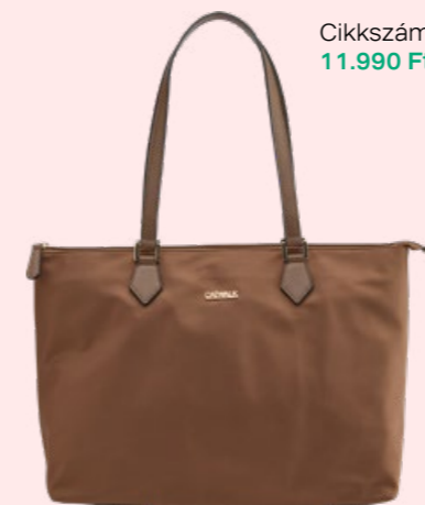
Cikkszám: 41105506 11.990 Ft