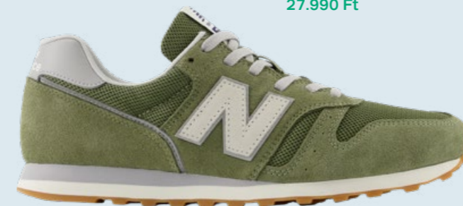
Cikkszám: 18403962 27.990 Ft