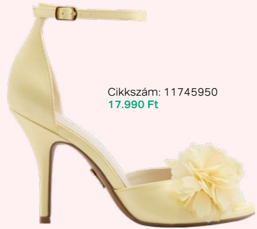
Cikkszám: 11745950 17.990 Ft