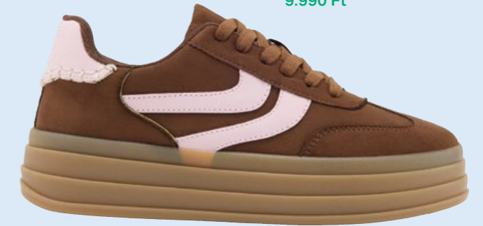
Cikkszám: 11025135 9.990 Ft