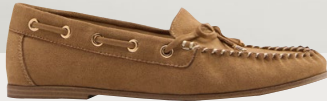
Cikkszám: 11445270 11.990 Ft