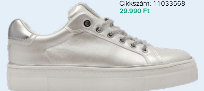
Cikkszám: 11033568 29.990 Ft