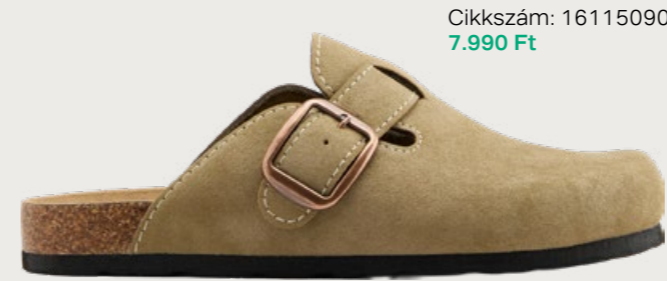
Cikkszám: 16115090 7.990 Ft