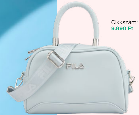
Cikkszám: 41045112 9.990 Ft