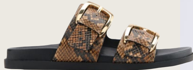
Cikkszám: 12615624 9.990 Ft