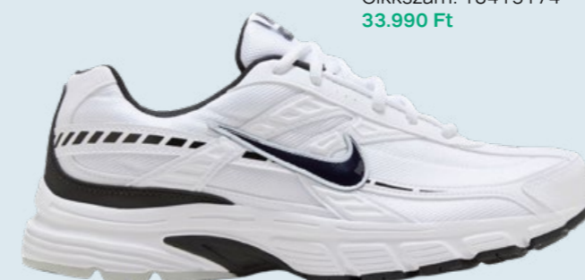
Cikkszám: 18413174 33.990 Ft