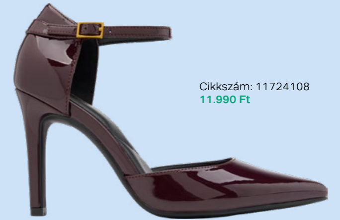
Cikkszám: 11724108 11.990 Ft