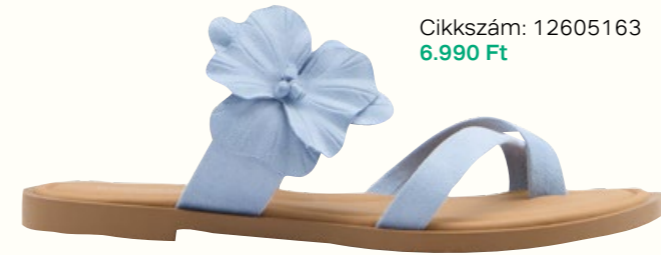
Cikkszám: 12605163 6.990 Ft

Kombináld őket egyszerű, egyszínű darabokkal, hogy a cipőd legyen az outfited központi eleme, vagy – az extrán trendi hatás érdekében – öltözz tetőtől talpig pasztellbe! A megjelenést természetesen egy színben passzoló kiegészítő vagy válltáska teszi teljessé – a különleges alkalmakra válassz egy elegáns, kisebb kiegészítőt, a hétköznapokra pedig egy praktikus, nagy méretű shoppert.