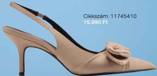
Cikkszám: 11745410 15.990 Ft