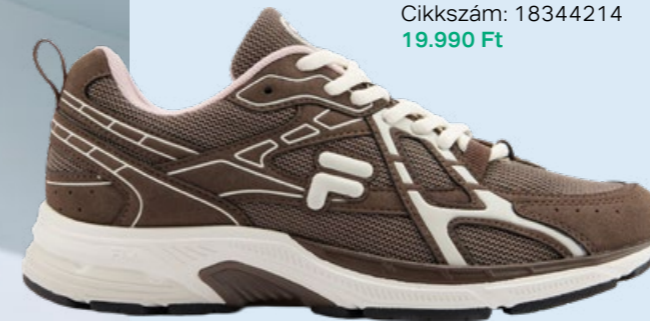
Cikkszám: 18344214 19.990 Ft