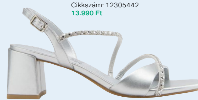
Cikkszám: 12305442 13.990 Ft

A csillogás nem áll meg az alkalmi daraboknál: beszivárog a sneakertrendek közé is. A fényes felületek és a sportos szilüettek találkozása modern, vagány kontrasztot teremt, ami jól passzol elegánsabb és hétköznapiabb outfitekhez egyaránt.