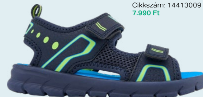
Cikkszám: 14413009 7.990 Ft