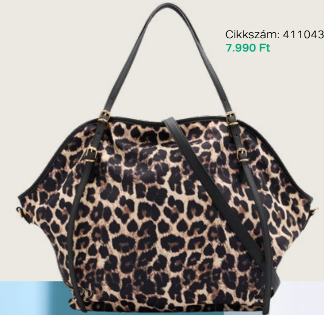
Cikkszám: 41104300 7.990 Ft