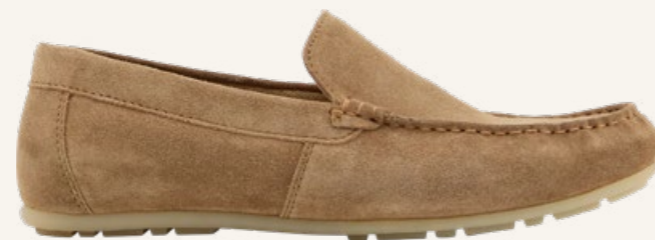
Cikkszám: 16633050 6.990 Ft