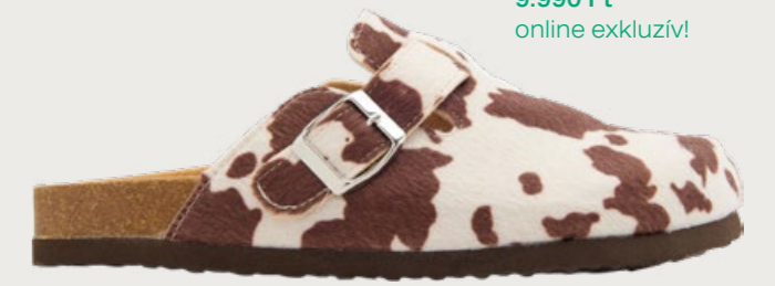
Cikkszám: 16114208 9.990 Ft online exkluzív!