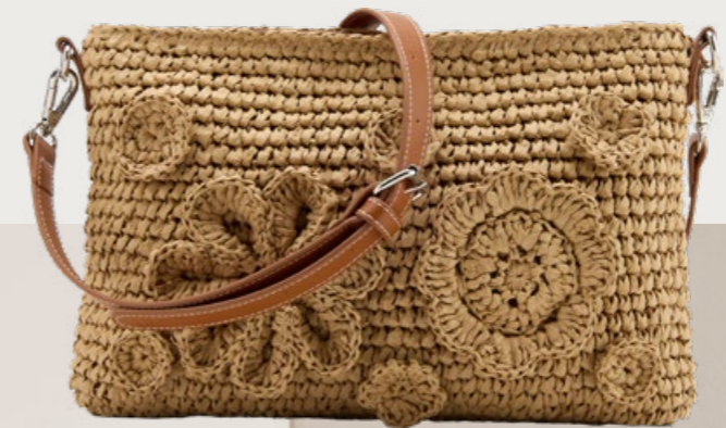
Cikkszám: 41005036 7.990 Ft