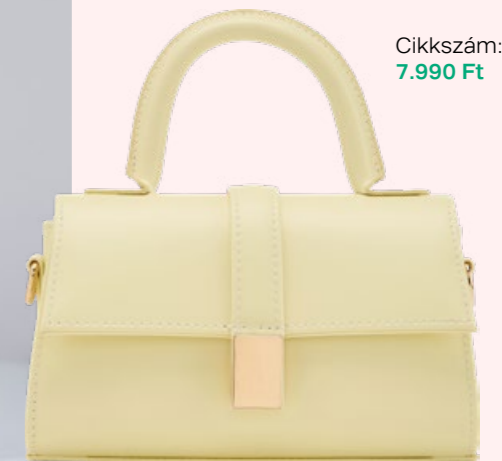
Cikkszám: 41005116 7.990 Ft