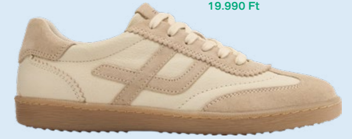
Cikkszám: 11075662 19.990 Ft