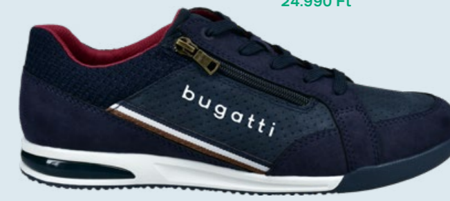
Cikkszám: 13135268 24.990 Ft