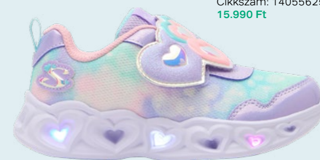
Cikkszám: 14055625 15.990 Ft