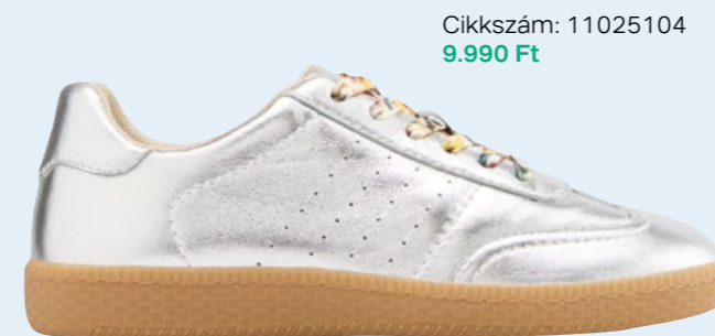
Cikkszám: 11025104 9.990 Ft