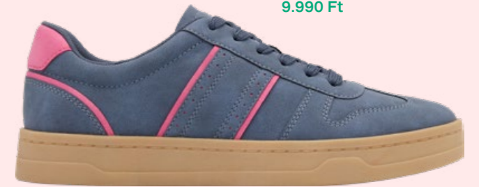
Cikkszám: 11025092 9.990 Ft