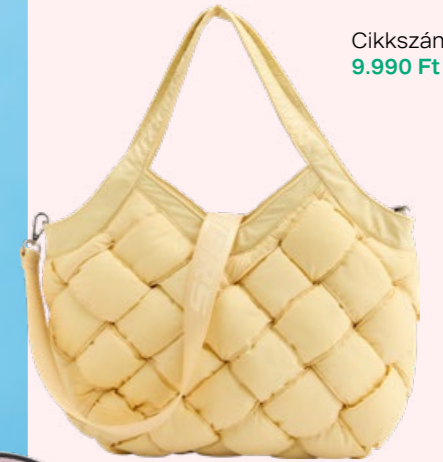
Cikkszám: 41095440 9.990 Ft