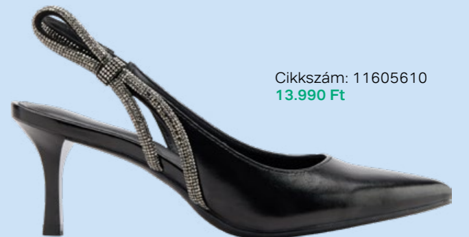
Cikkszám: 11605610 13.990 Ft