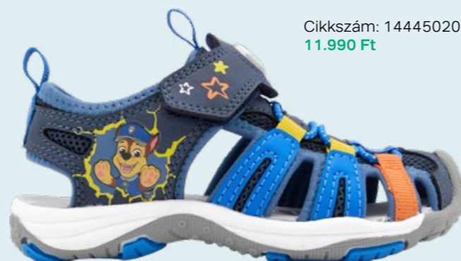
Cikkszám: 14445020 11.990 Ft