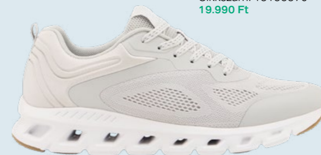
Cikkszám: 13135370 19.990 Ft

A mélyített talpú- és keresztpántos papucsok, valamint a klumpák a melegebb napokon is kényelmes, mégis karakteres választást jelentenek. Különösen divatosak gazdag földtónusokban, például homokszínűben vagy mély barnában.