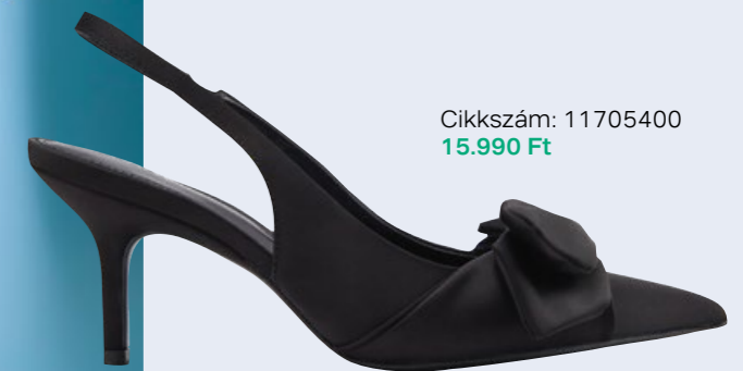
Cikkszám: 11705400 15.990 Ft