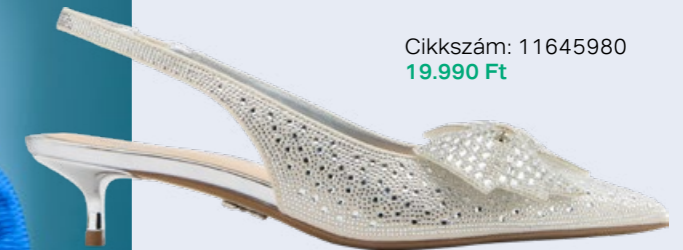
Cikkszám: 11645980 19.990 Ft