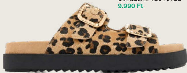
Cikkszám: 12613722 9.990 Ft