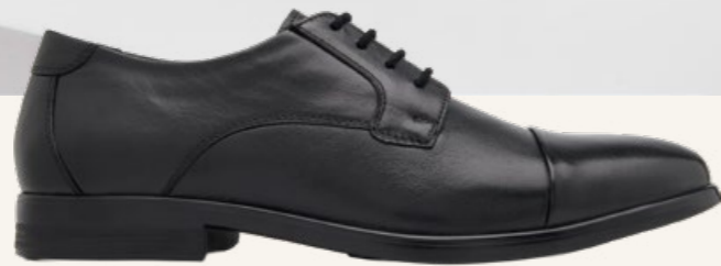
Cikkszám: 13235300 19.990 Ft