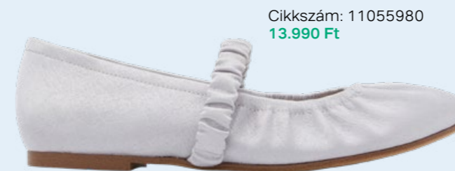
Cikkszám: 11055980 13.990 Ft