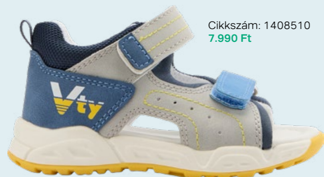
Cikkszám: 1408510 7.990 Ft