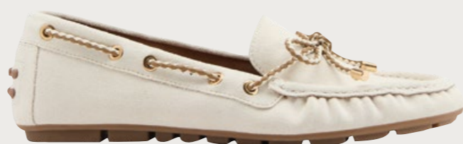
Cikkszám: 11445220 11.990 Ft