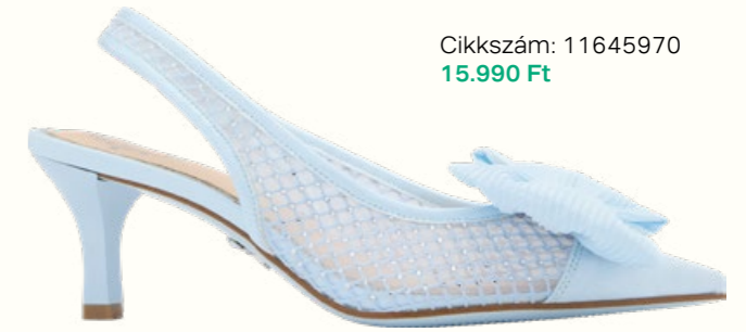
Cikkszám: 11645970 15.990 Ft