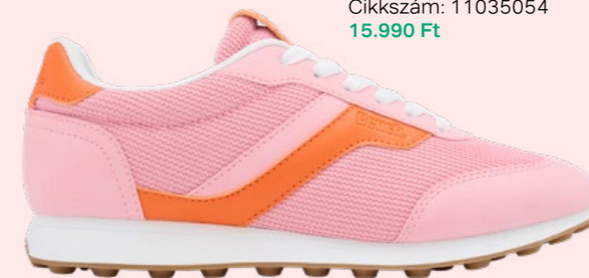
Cikkszám: 11035054 15.990 Ft