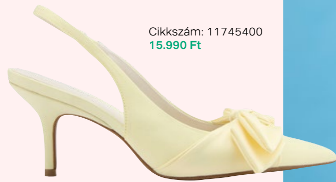
Cikkszám: 11745400 15.990 Ft