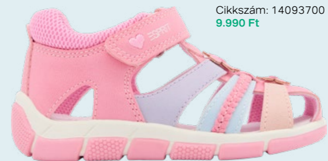
Cikkszám: 14093700 9.990 Ft