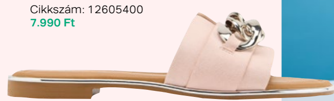
Cikkszám: 12605400 7.990 Ft