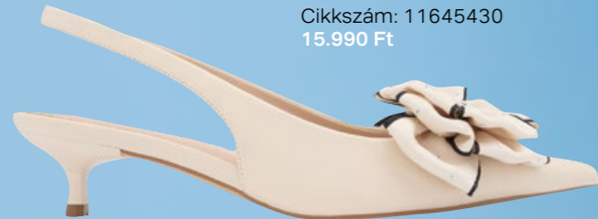
Cikkszám: 11645430 15.990 Ft