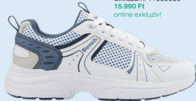
Cikkszám: 11035080 15.990 Ft online exkluzív!