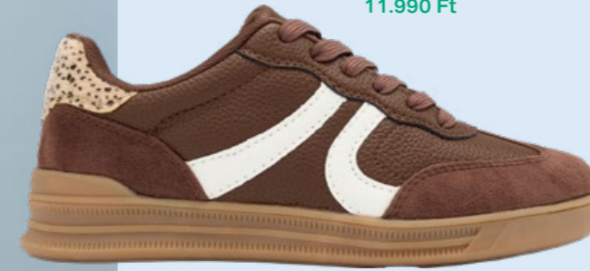
Cikkszám: 11024399 11.990 Ft