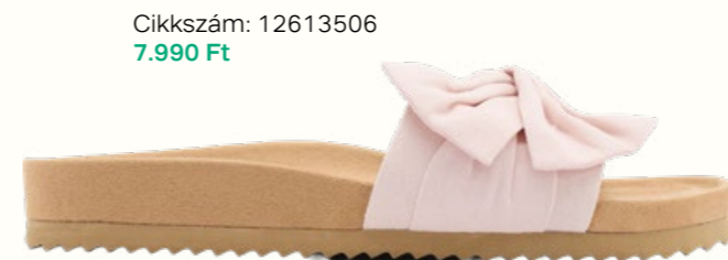
Cikkszám: 12613506 7.990 Ft