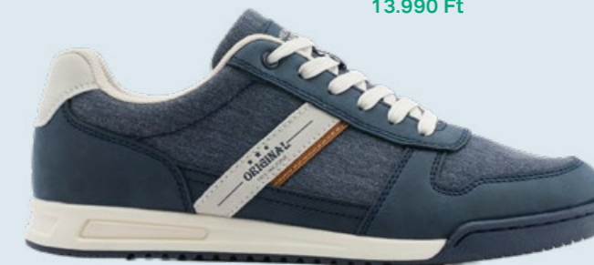
Cikkszám: 13133289 13.990 Ft