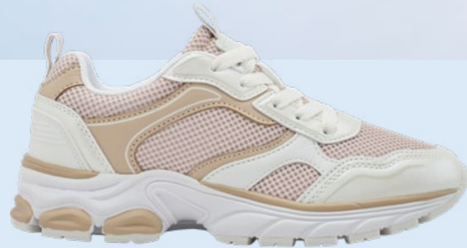
Cikkszám: 11023344 11.990 Ft