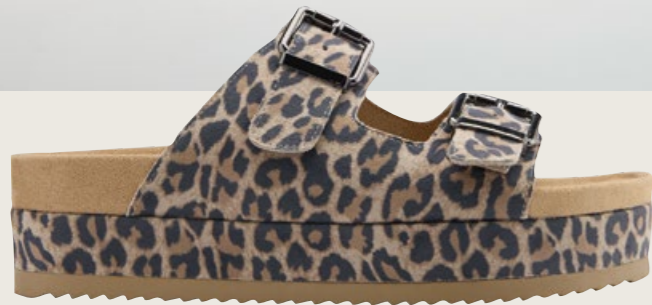
Cikkszám: 12625034 9.990 Ft